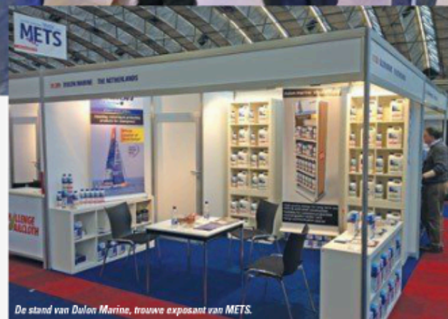
De stand van Dulon Marine, trouwe exposant van METS.